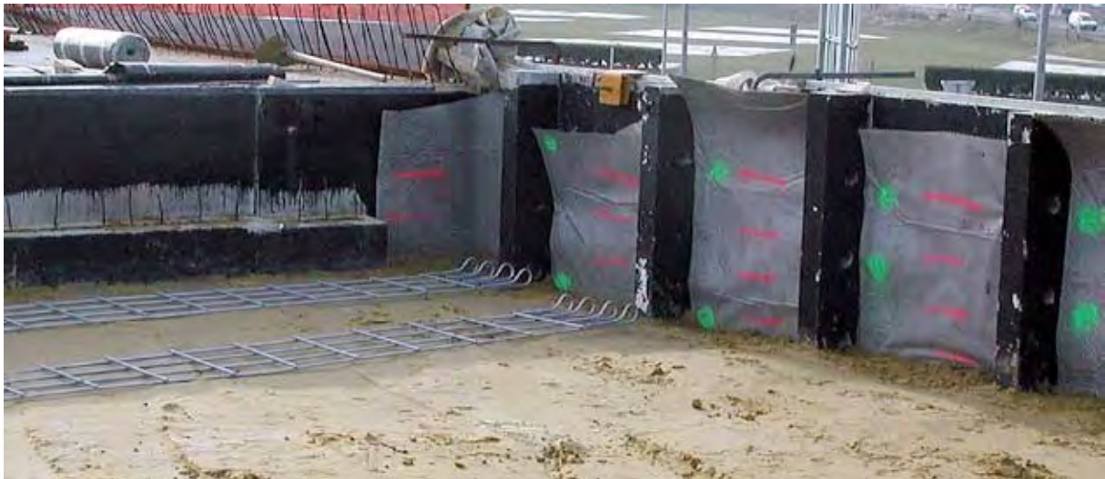
Photo 2 : mise en place des armatures sur le remblai compact  avant fixation au parement