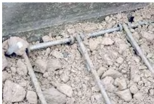
Photos 3 : exemples de systèmes de fixation des armatures au parement